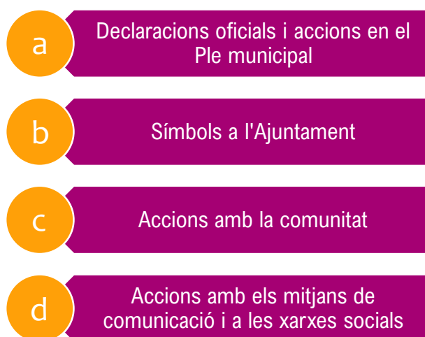
Figura 2. Tipologia d'accions

En el cas que es produeixi un femicidi a la ciutat de Rubí, s'activaran totes les accions del circuit que marca el Protocol Municipal d'Abordatge de la Violència Masclista. A banda d'aquestes accions, l'Ajuntament de Rubí, amb la coordinació de les diverses àrees implicades, durà a terme les actuacions que es detallen i descriuen a continuació per tal de mostrar al conjunt de la ciutadania el rebuig institucional cap a les violències masclistes.